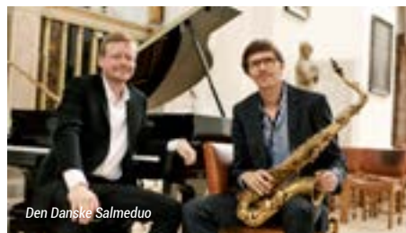
Den Danske Salmeduo

Genforeningskoncert med Den Danske Salmeduo i Frimenighedskirken.